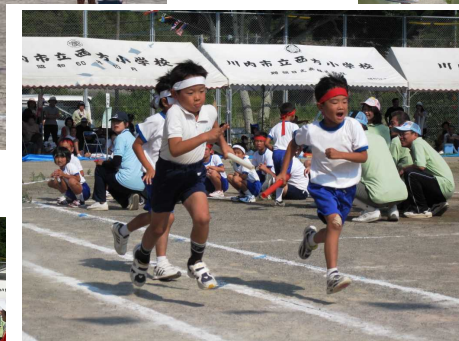
走れ！つなげ！！ 「紅白リレー」