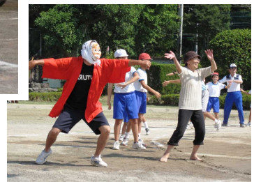
校区のみなさん飛び入り参加！ 「川内はんや節」