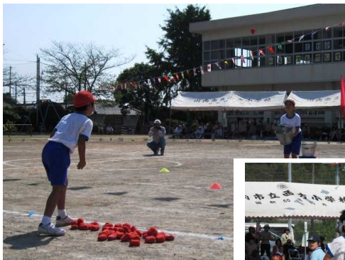
うまく入るかな？ 「バケツに入りそう!？」