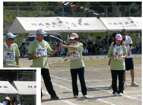
50歳組のみなさんも 元気に参加しました！